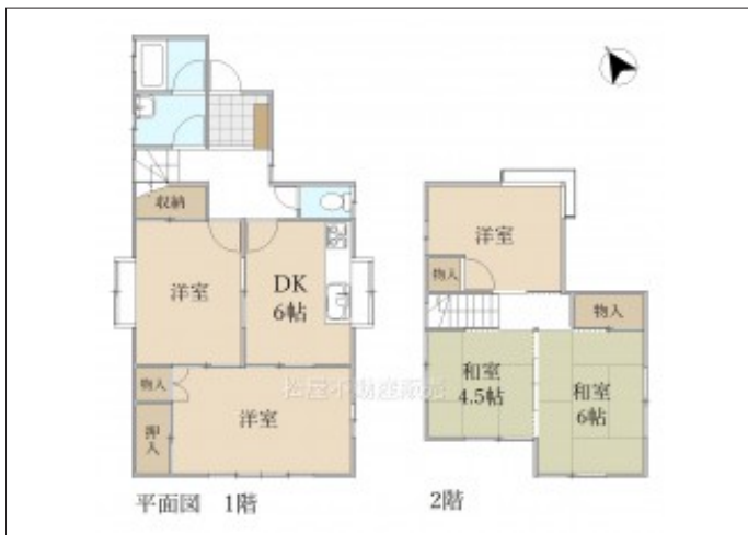
写真 部屋数ゆとりの5DK! 岩西小学校が近く子育て世代にもオススメ!