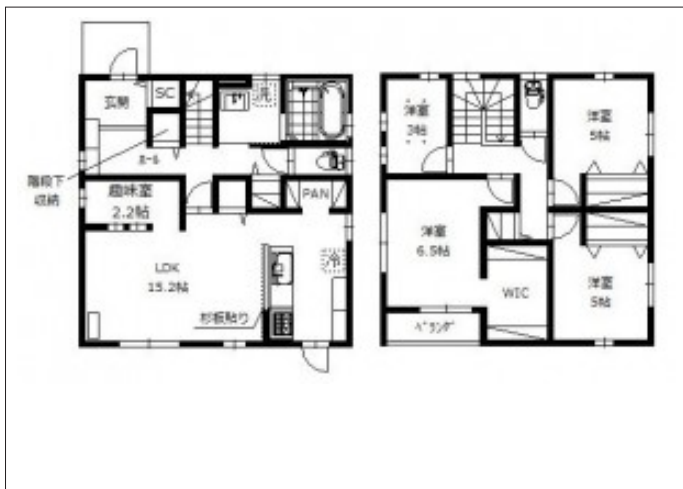
写真 【完成しました!】・オール電化住宅・4LDK