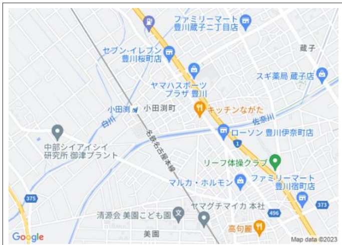
写真 名鉄「小田渚駅」徒歩4分の好立地!