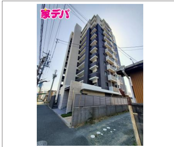
写真 2LDK 図面と現況に相違ある場合には現況優先とします。