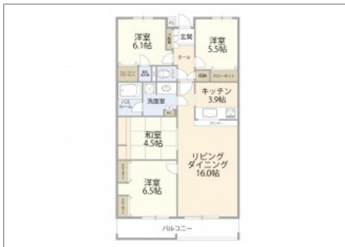
写真 【リフォーム物件】和室完備の4LDK。中野小学校まで徒歩4分。