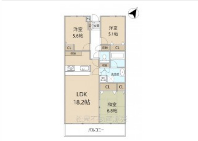
写真 中野小学校、マックスバリュが至近の好環境!リフォーム済3LDK、