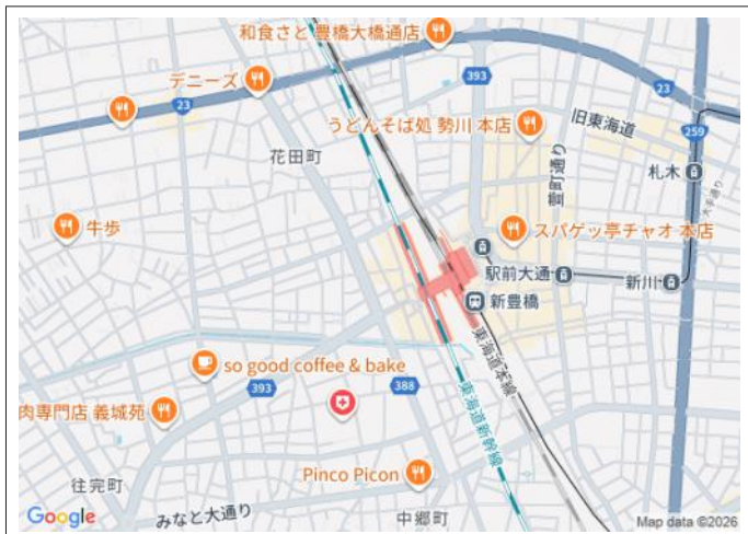
写真 「豊橋」駅まで徒歩5分!通勤や通学にも便利な立地です。家具な