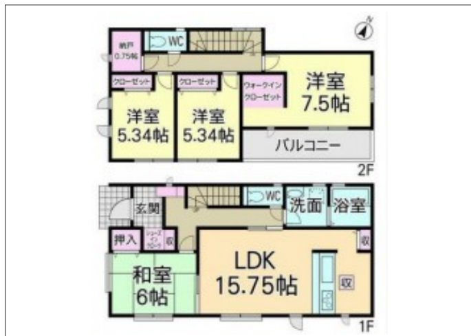
写真 全居室南向きで陽当たり良好!納戸完備の「4SLDK」パントリー完