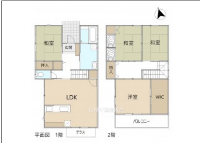
写真 サンプルーム完備の「4LDK」各階に和室完備。リビング16.5帖。開