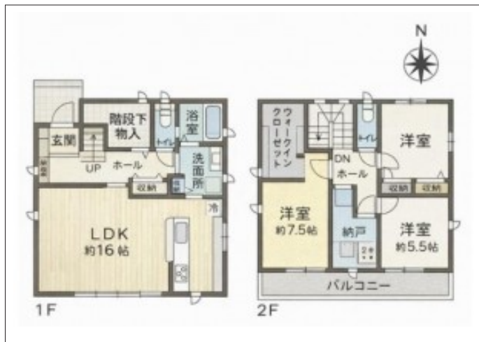
写真 収納豊富な「3SLDK」。納戸完備。2部屋からアクセスできるバル