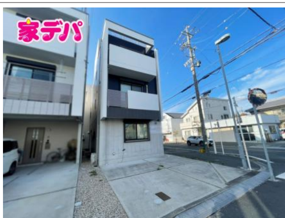
写真 4LDK 図面と現況に相違ある場合には現況優先とします。