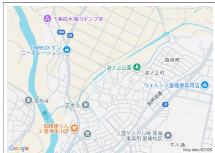
写真 小学校・幼稚園・病院・スーパーが徒歩圏内に揃い、生活利便性