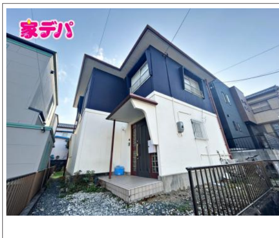
写真 図面と現況に相違ある場合には現況優先とします。