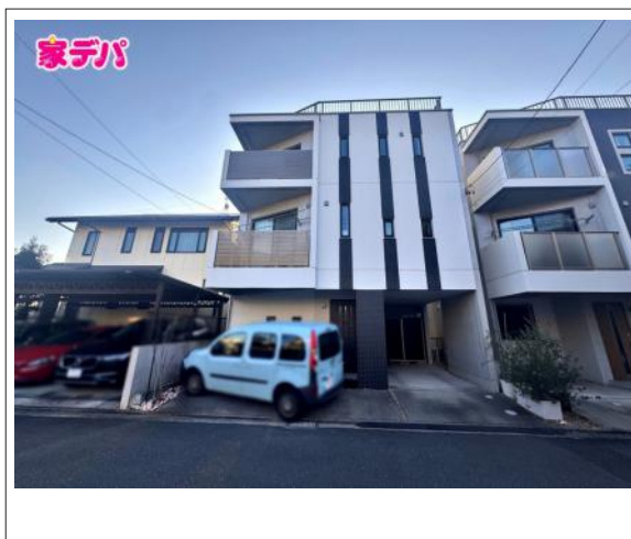
写真 3SLDK 図面と現況に相違ある場合には現況優先とします。