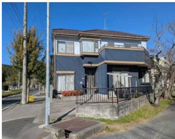
写真 4LDK 図面と現況に相違ある場合には現況優先とします。