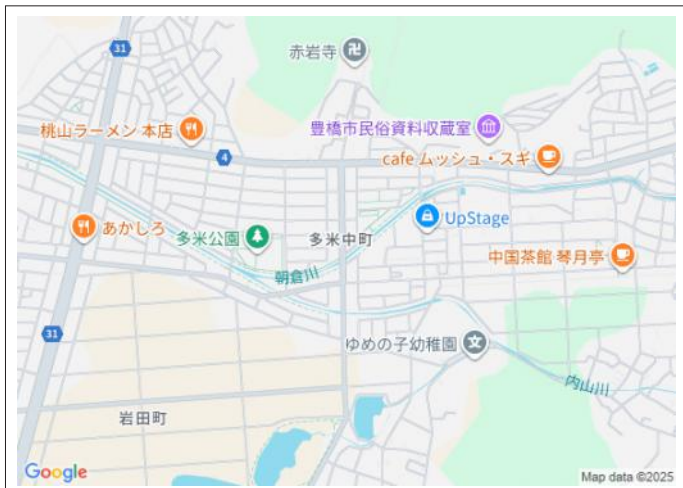
写真 角地!小・中学校が徒歩圏内!全室南向き、日当たり風通し良好!全