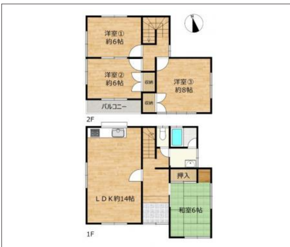
写真 【リフォーム前の間取り】