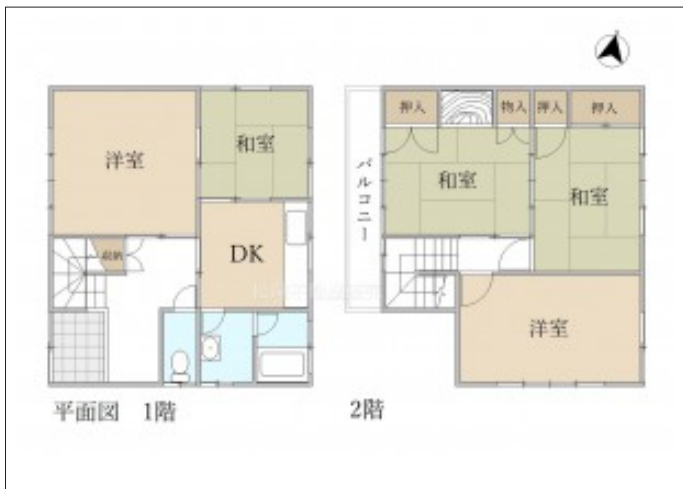
写真 敷地面積52坪の5DK、間口も広々としていて快適な住環境です。