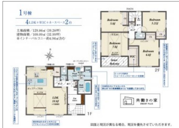
写真 4LDK 図面と現況に相違ある場合には現況優先とします。