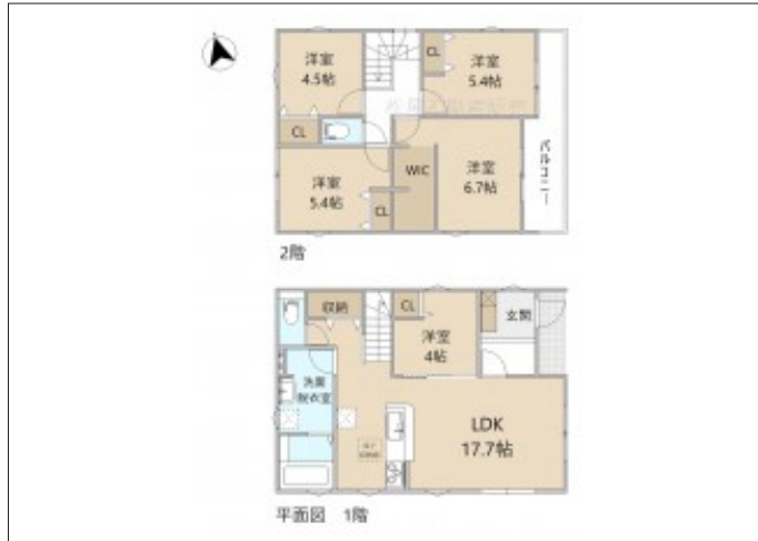
写真 5LDK 図面と現況に相違ある場合には現況優先とします。