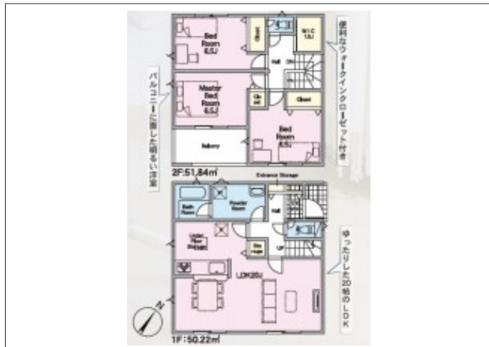
写真 【8号棟】 建築予定地です！・3LDK・LDK20帖・全居室収納完備