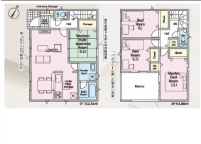
写真 【2号棟】 建築予定地です! ・4LDK ・LDK17帖、隣接和室5.2帖