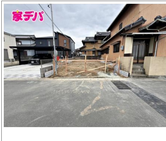
写真 2SLDK 図面と現況に相違ある場合には現況優先とします。