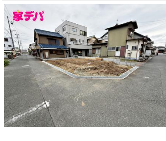
写真 3LDK 図面と現況に相違ある場合には現況優先とします。