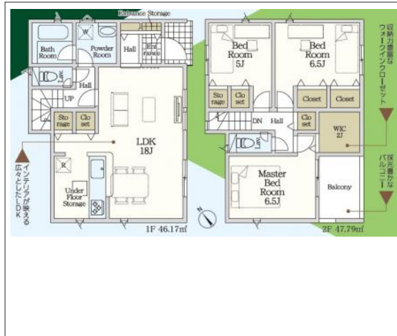
写真 3LDK 図面と現況に相違ある場合には現況優先とします。