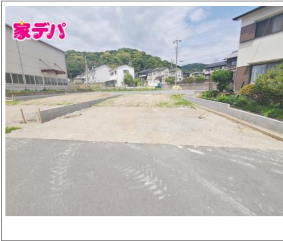
写真 建築予定地です。ご見学希望のお客様につきましては同型同仕様