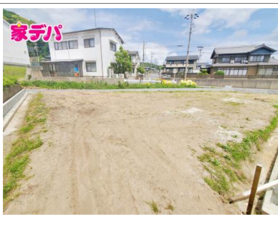
写真 建築予定地です。ご見学希望のお客様につきましては同型同仕様