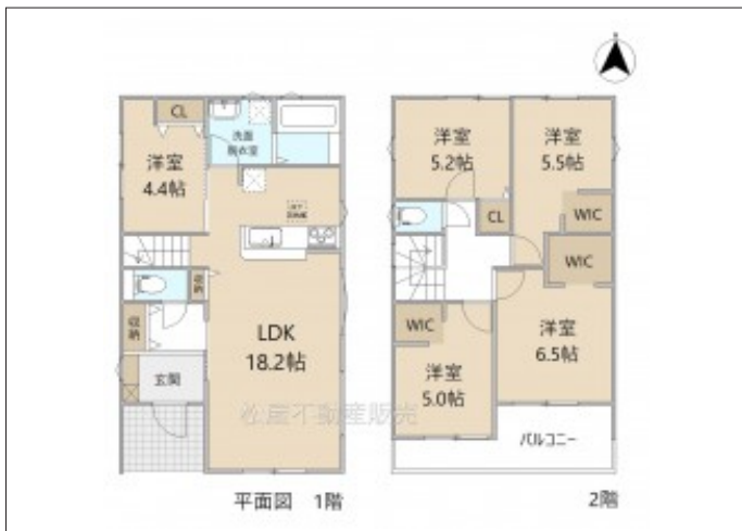
写真 【3号棟】建築予定地です!・長期優良住宅・4LDK