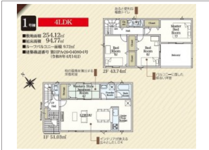
写真 4LDK 図面と現況に相違ある場合には現況優先とします。