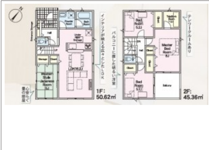
写真 4LDK 図面と現況に相違ある場合には現況優先とします。