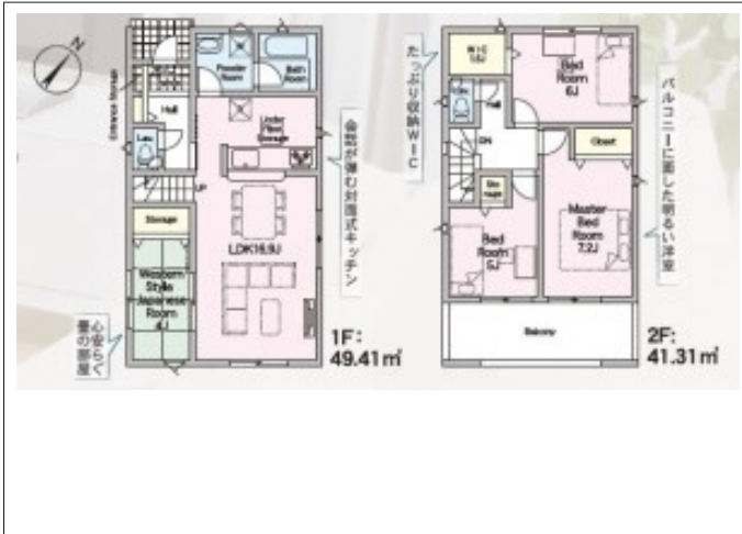
写真 4LDK 図面と現況に相違ある場合には現況優先とします。