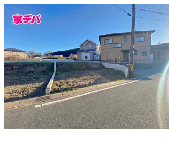
写真 4LDK 図面と現況に相違ある場合には現況優先とします。