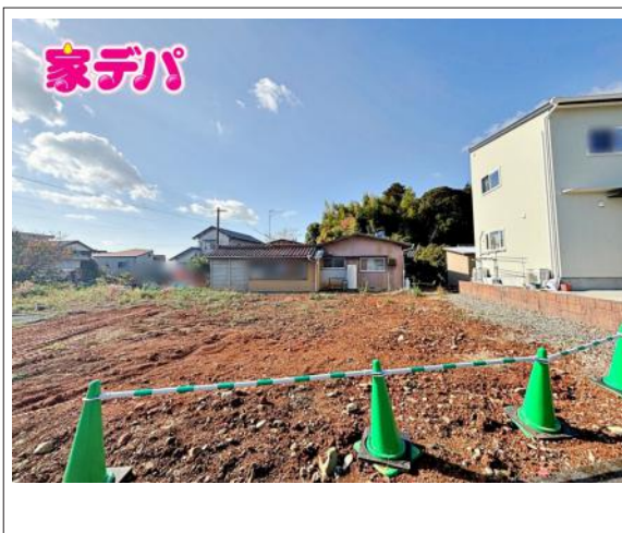
写真 4LDK 図面と現況に相違ある場合には現況優先とします。