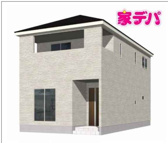
写真 【完成予想外観】