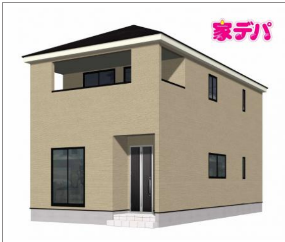
写真 【完成予想外観】