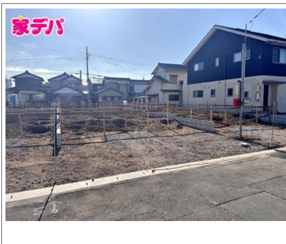
写真 3SLDK 図面と現況に相違ある場合には現況優先とします。