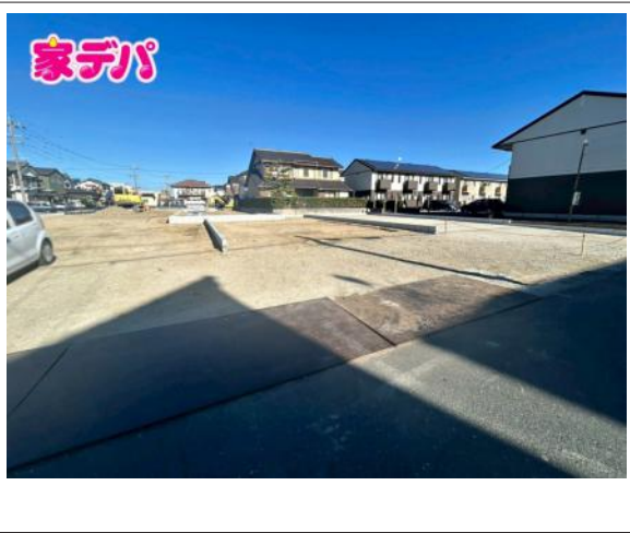
写真 4LDK 図面と現況に相違ある場合には現況優先とします。