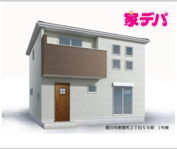
写真 3LDK 図面と現況に相違ある場合には現況優先とします。