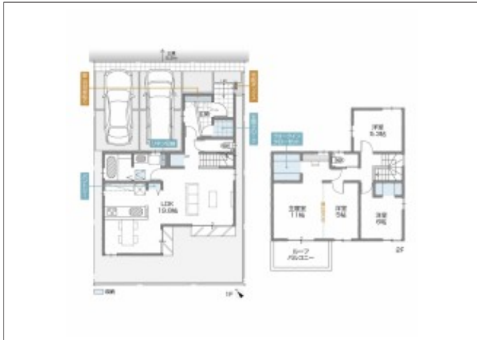
写真 【E号棟】完成しました!・4LDK・LDK19.8帖