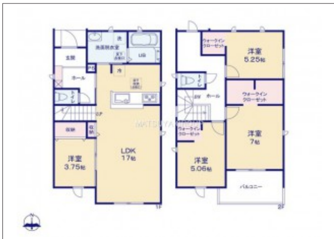
写真 【1号棟】完成予想図・4LDK・LDK17帖、隣接洋室3.75帖