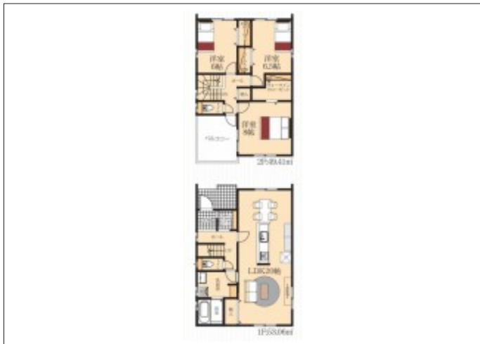
写真 【限定1邸】3LDK・駐車スペース並列3台・LDK20帖