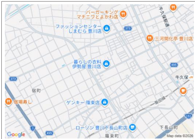
写真 敷地面積約57坪!建築条件のない土地でお客様のご希望に沿った住