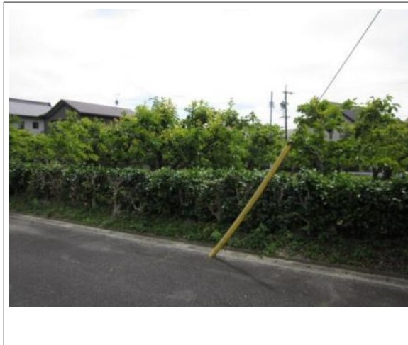
写真 B区画 図面と現況に相違ある場合には現況優先とします。