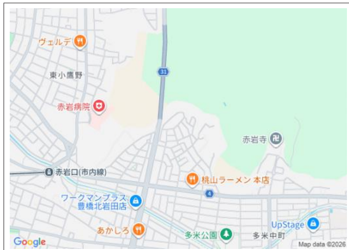
写真 【建築条件なし】お好きなハウスメーカーで建築可能。主要道路