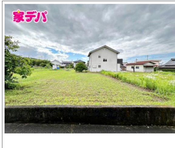
写真 3号地 図面と現況に相違ある場合は現況優先とします。