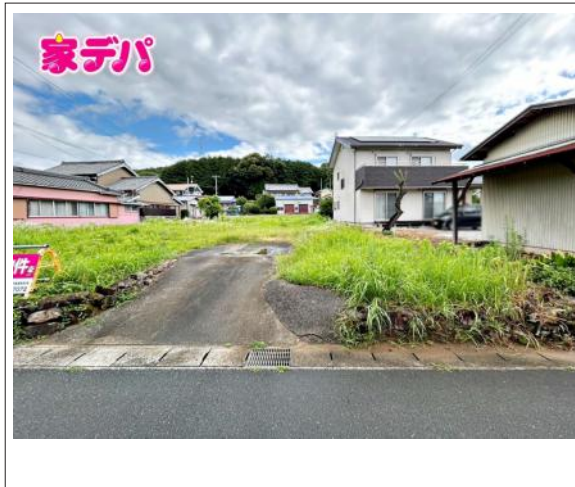
写真 2号地 図面と現況に相違ある場合は現況優先とします。