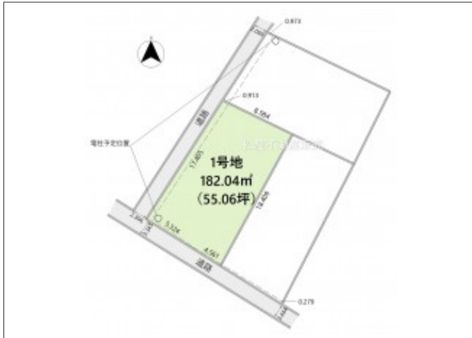
写真 【1号地】角地につき開放感があり、採光や風通しにも恵まれた立