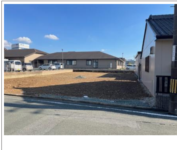
写真 整形地 図面と現況に相違ある場合には現況優先とします。