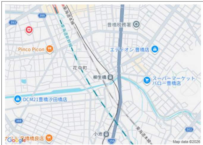
写真 豊橋鉄道渥美線「柳生橋」駅まで徒歩2分!土地面積128坪超の広々