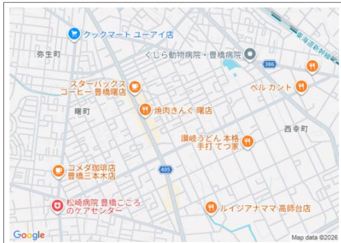
写真 小・中学校や公園が近く、子育て世代にうれしい立地!建築条件な