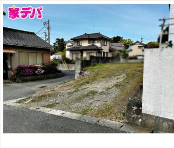
写真 1区画 図面と現況に相違ある場合には現況優先とします。