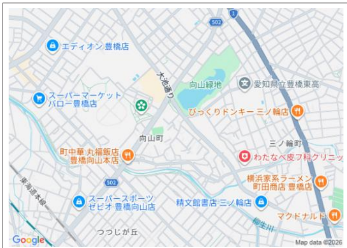
写真 商業施設まで徒歩圏内!【建築条件なし】お好きなハウスメーカー