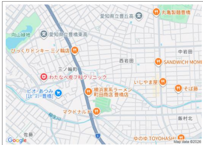
写真 豊小学校まで徒歩6分!買い物施設が徒歩圏内で生活便利!建築条件