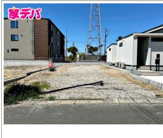
写真 B区画 図面と現況に相違ある場合には現況優先とします。