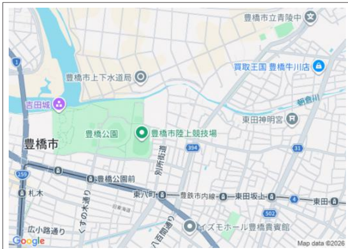
写真 八町小学校まで徒歩7分!整形地。建築条件はありません。豊橋鉄